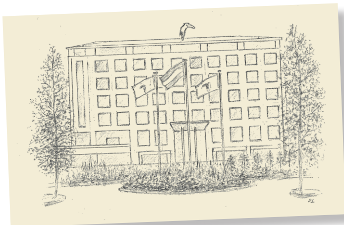
Zeichnung von R. Langebeek